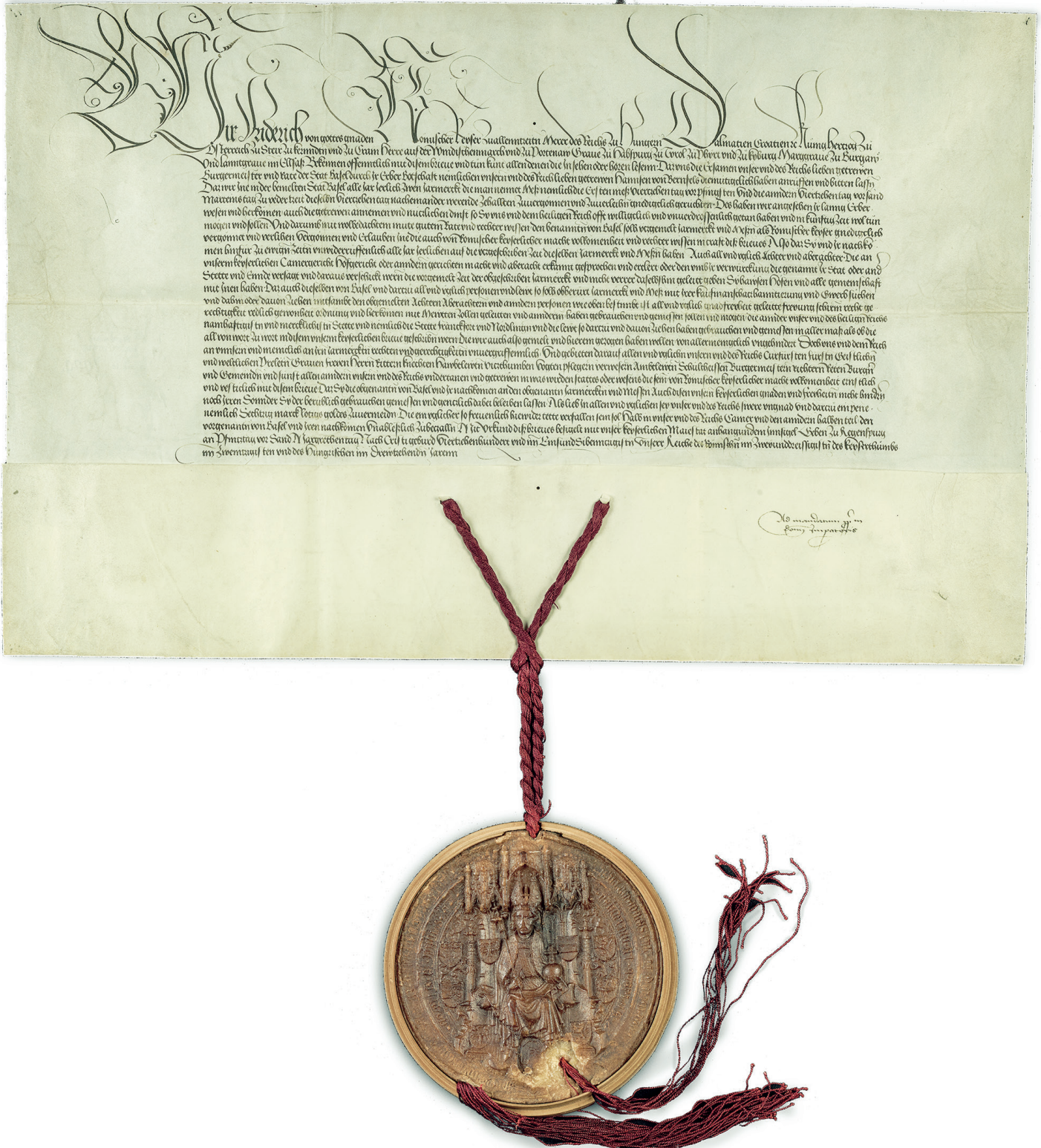
Staatsarchiv Basel-Stadt, St. Urk. 1909.

Brief zur Eröffnung und Durchführung zweier Jahrmessen, 11. Juli 1471.