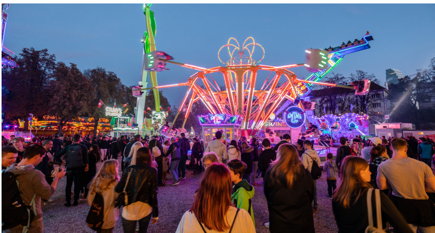
Die Swing Up ist ein echter Klassiker und beliebt bei Klein und Gross.