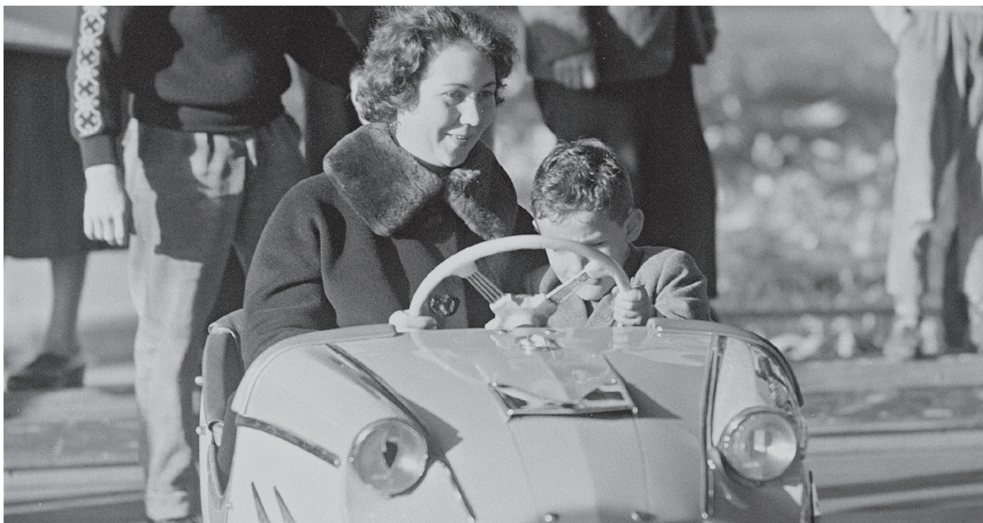
1960 sahen die Botschauteli auf dem Messeplatz so aus.