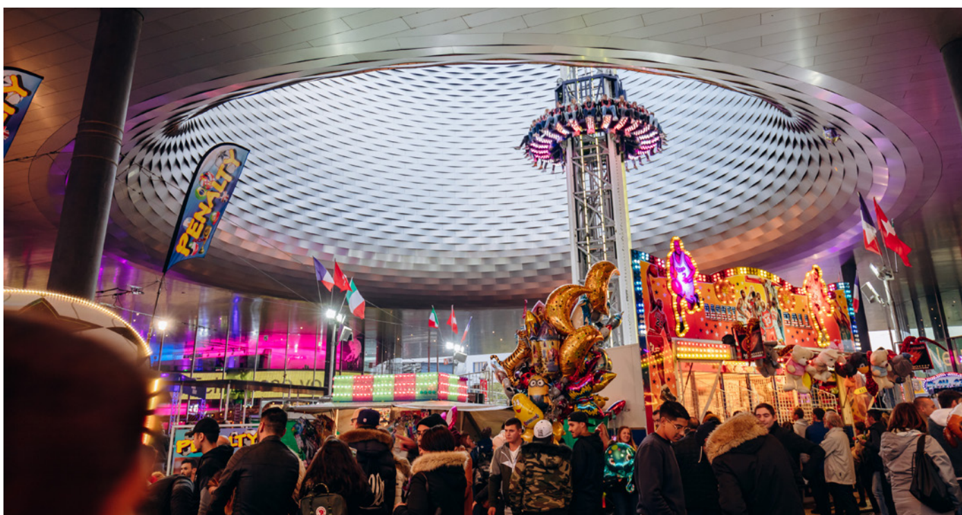
Wer den Messeplatz von oben sehen will, probiert den Free Fall Tower aus.