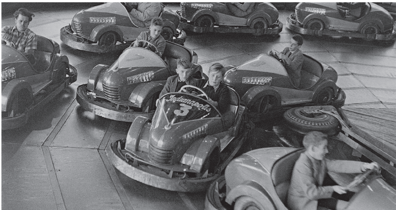
1951 waren die Botschauteli vor allem Männer- bzw. Bubensache...