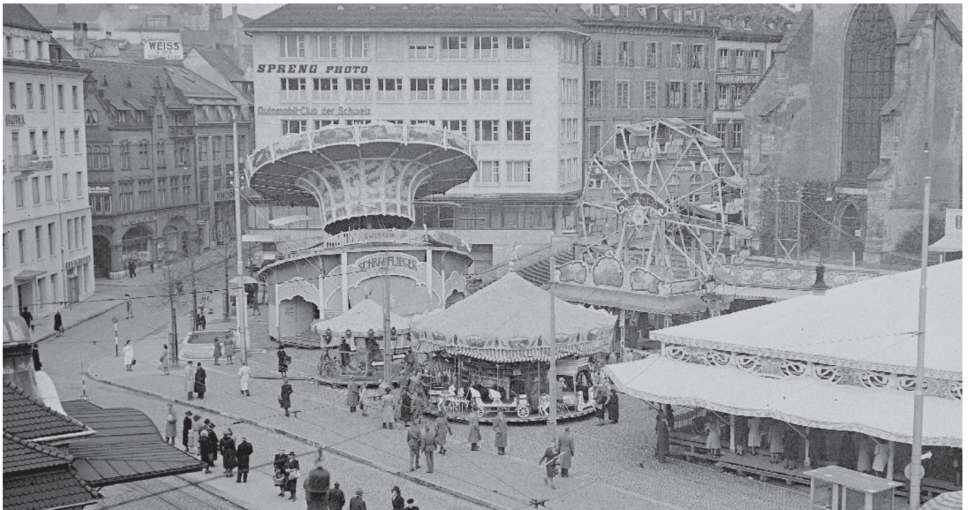
Fast wie heute: Kettenkarussell, Resselirytty und Riesenrad gab es schon 1944.