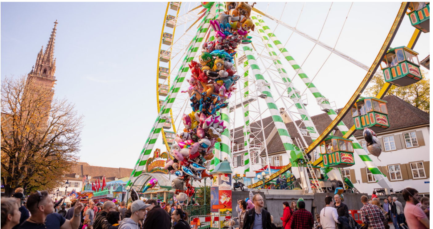
Wow, so viele farbige Ballone. Und warst du eigentlich schon mal auf dem Riesenrad?