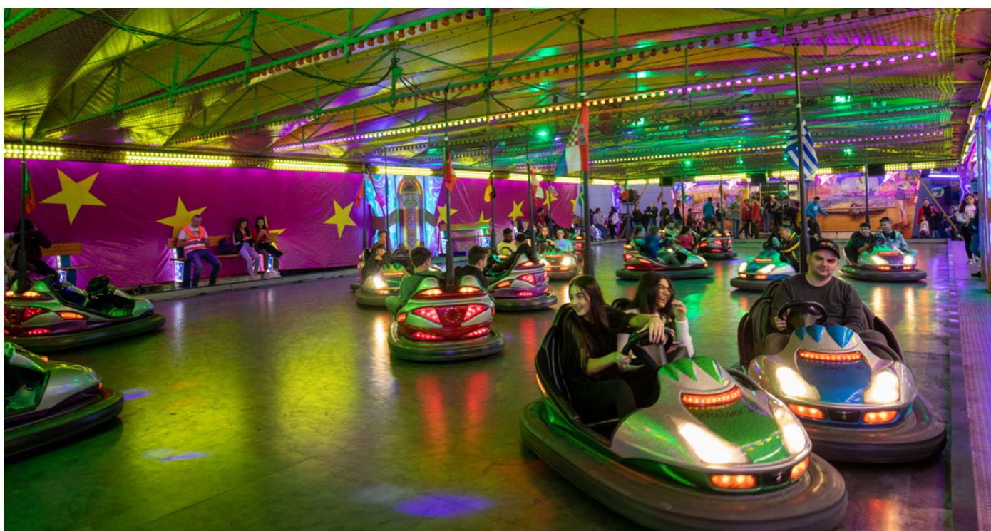
... heute sind die kleinen Flitzer auch bei den Mädchen und Frauen beliebt.