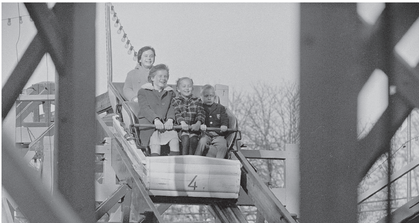
Bereits 1963 durften die Basler Messebesucher auf der Rosentalanlage Achterbahn fahren.