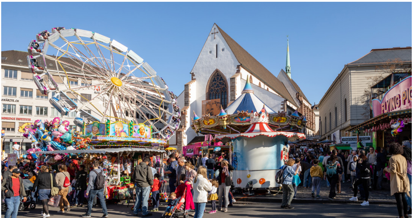
Ui, diese Bahn sieht schnell aus. Hoffentlich wird niemandem schlecht!