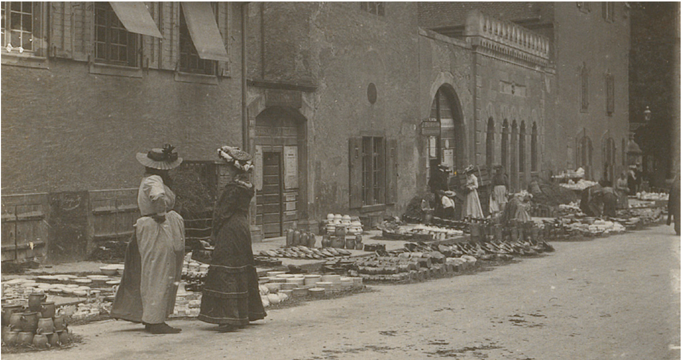
Der Verkauf von Tassen, Tellern oder Suppenschüsseln hat auf dem Hääfelimäart Tradition.