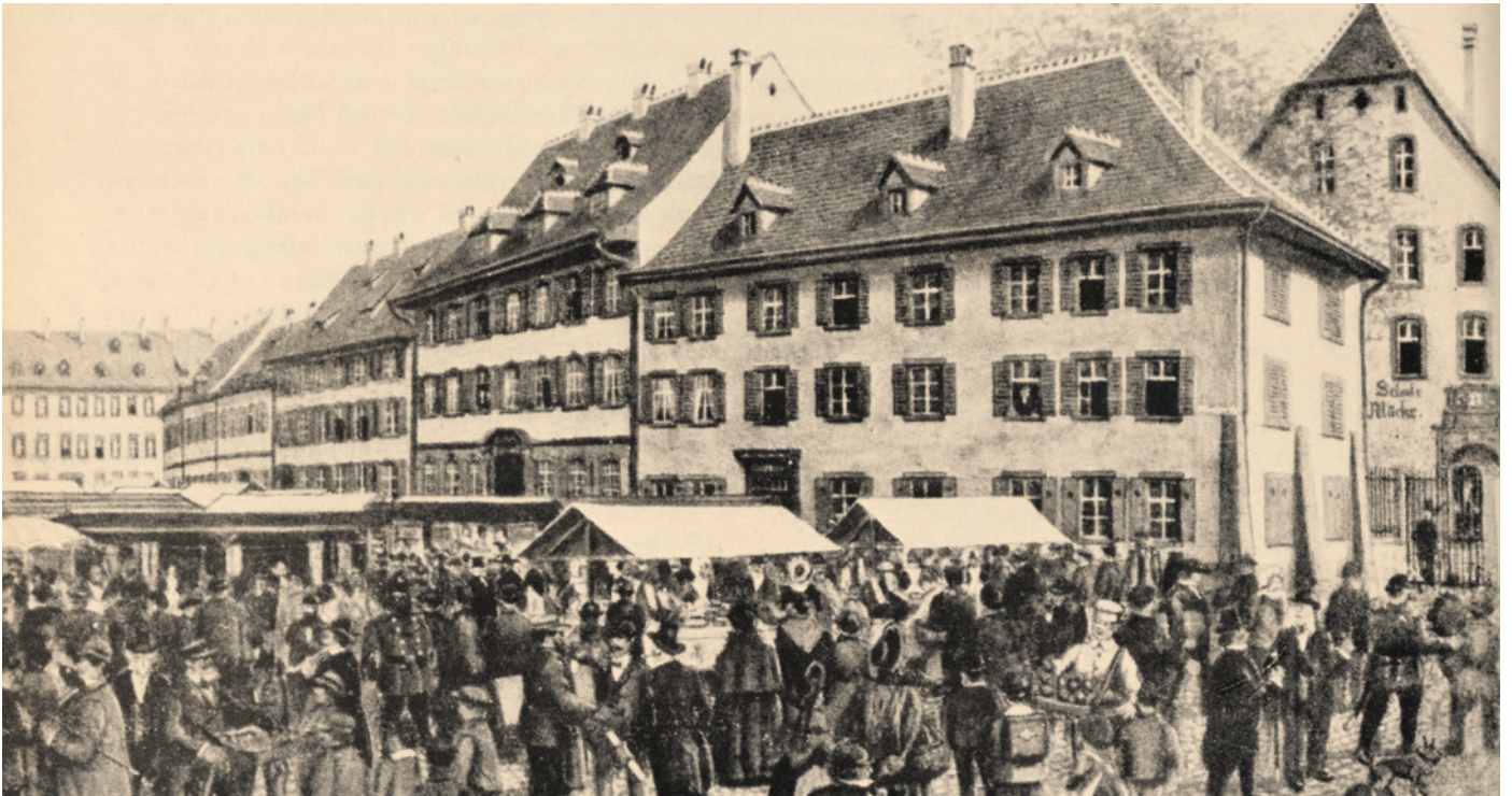
Die Herbstmesse 1863: Statt Bahnen gab es auf dem Münsterplatz einen Markt. 550 Jahre Basler Herbstmesse, Spalendor Verlag.