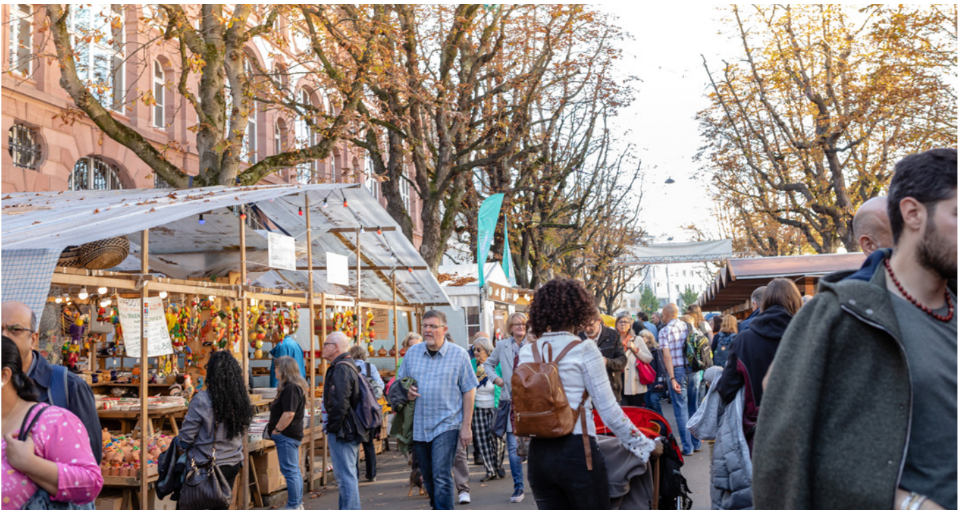
Ein gut besuchter Tag am Hääfelimäart.