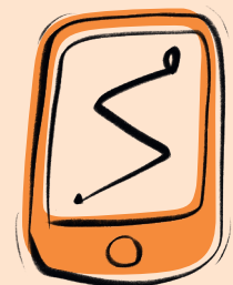
3. Google Maps