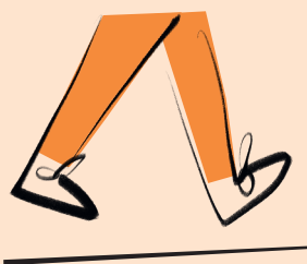
1. Schritte zählen

Drei Möglichkeiten, um die Entfernung zwischen den Standorten der Herbstmesse herauszufinden: