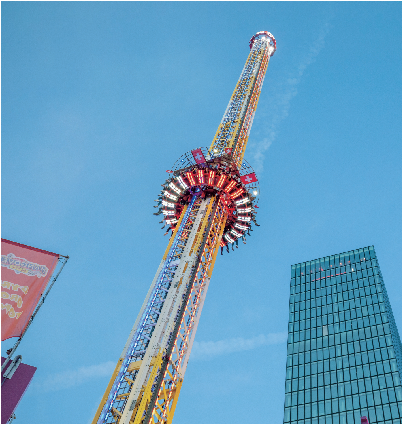
Free Fall Tower «Hangover» am Messeplatz.

Versuche, ein paar der folgenden Bahnen mit den verschiedenen Zeichentechniken zu zeichnen.