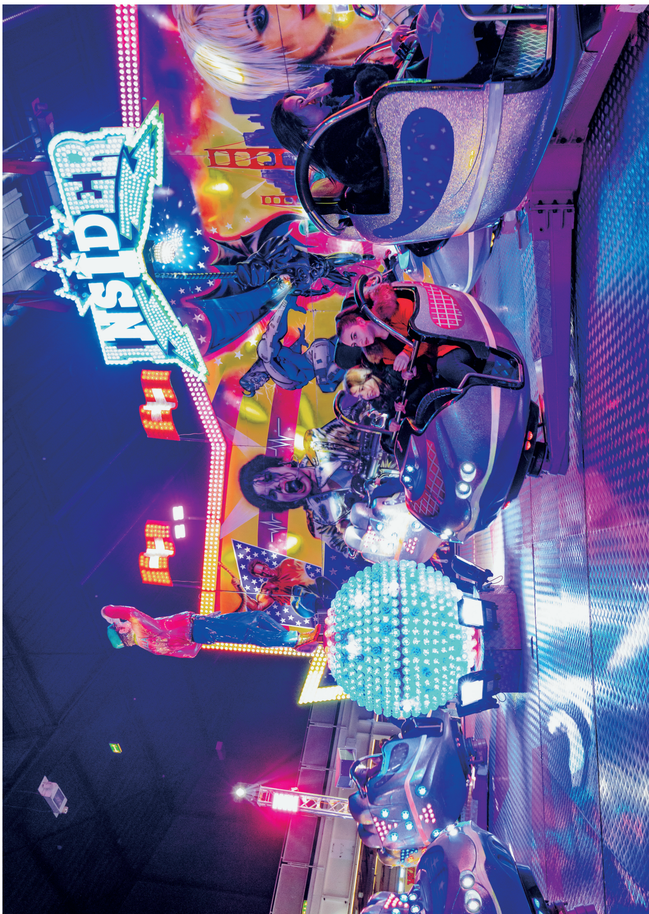
«Break Dance» in der 80s Halle.