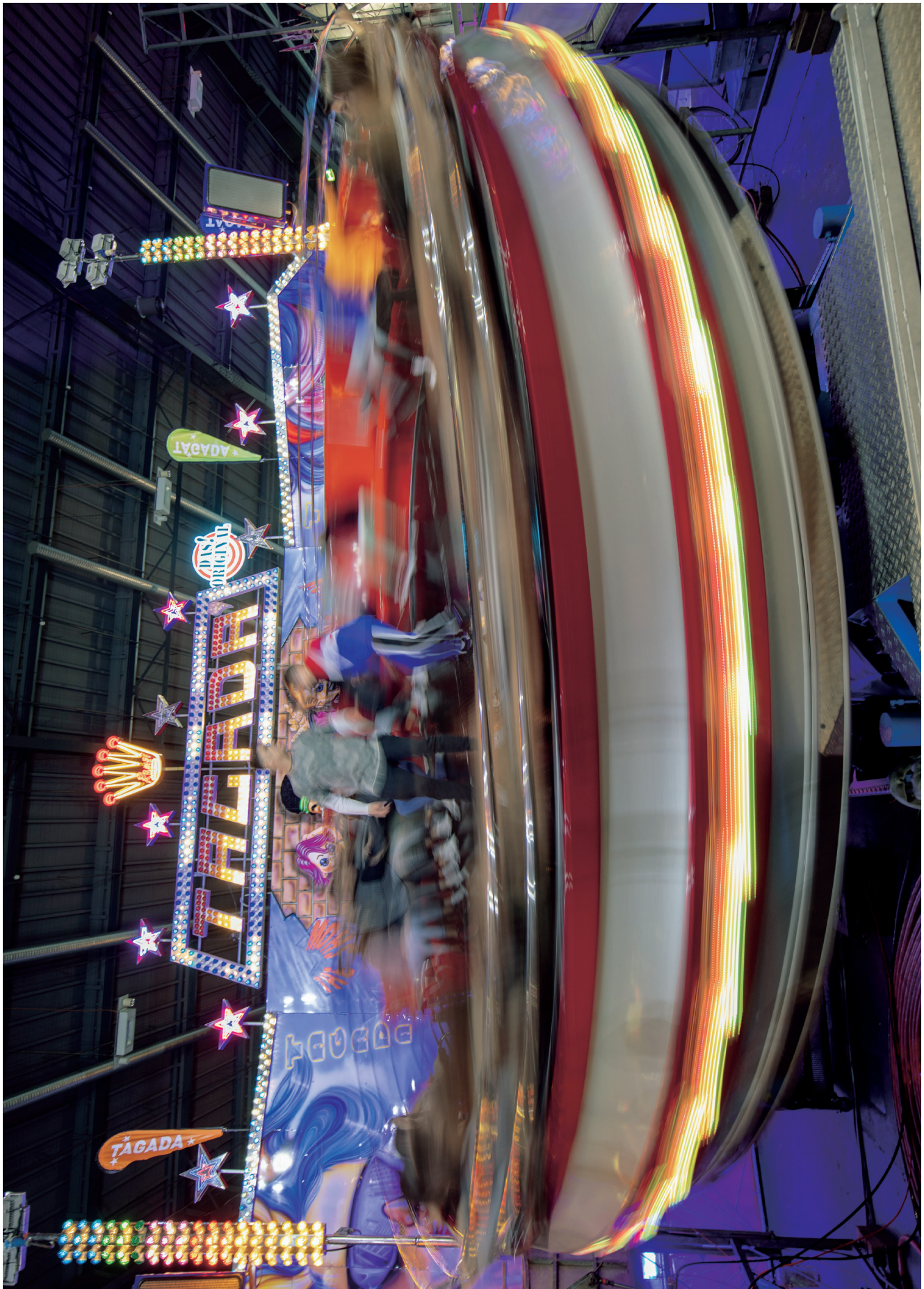
Tagada in Bewegung in der 80s Halle.