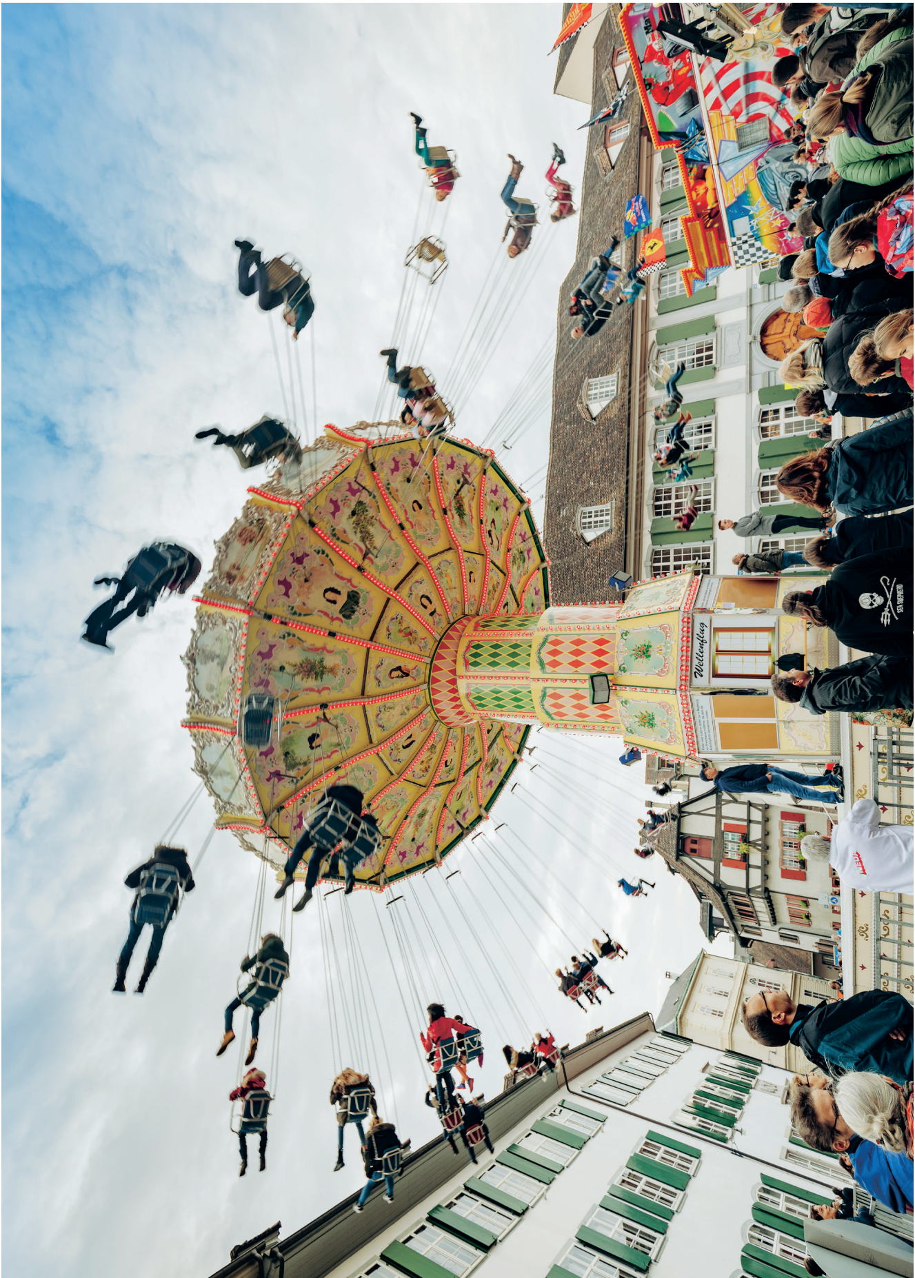
Kettenkarussell auf dem Münsterplatz.